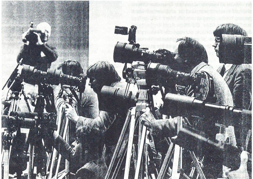
Bildreporter beim «scharfen Schuss».

Wir stehen derzeit mitten in einem «Revolutionprozess» durch Bild- und Tondokumen-