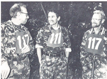
Letzte Besprechung vor dem Start.