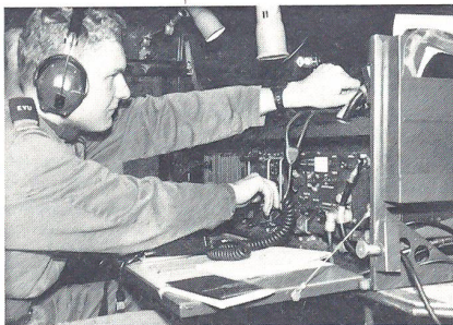
Kurzwellenfunkgeräte SE-412 stellten Verbindungen her.