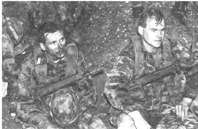
Abgekämpft und gekennzeichnet vom Gefechtseinsatz, wird der Manöverkritik zugehört.