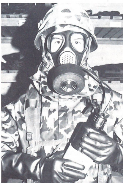
Sogar Flüssigkeitsaufnahme durch die neue Schutzmaske ist möglich.

Am Nachmittag folgte eine Besichtigung der Panzertruppen mit Leopard Tanks mit abschliessender Visite bei den Materialtruppen, Rekrutenschule (RS) 282. Der Dienstag brachte den Besuch der Munitionsfabrik Thun sowie einen Truppenbesuch beim Inf Rgt 27. Eine Besichtigung in Chamblon beim Umschulungskurs 1 der Panzerjäger als auch ein