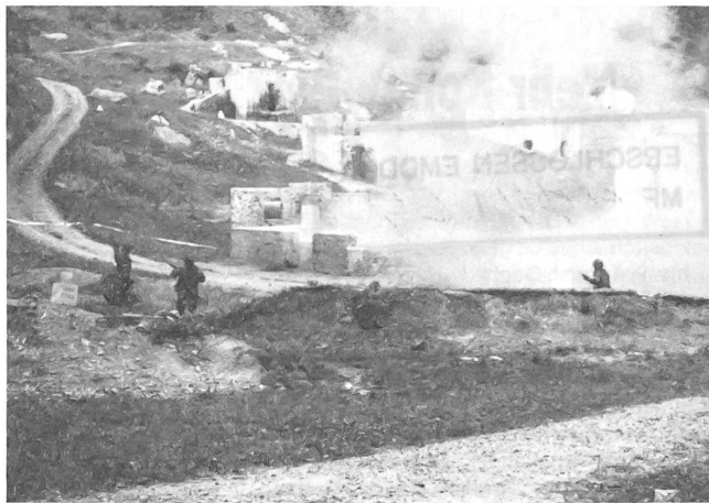
Vorstoss mit baldigem Eingriff in den Häuserkampf.