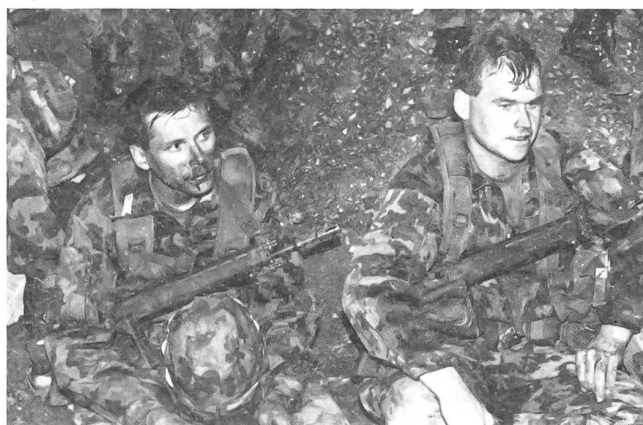
Abgekämpft und gekennzeichnet vom Gefechtseinsatz, wird der Manöverkritik zugehört.