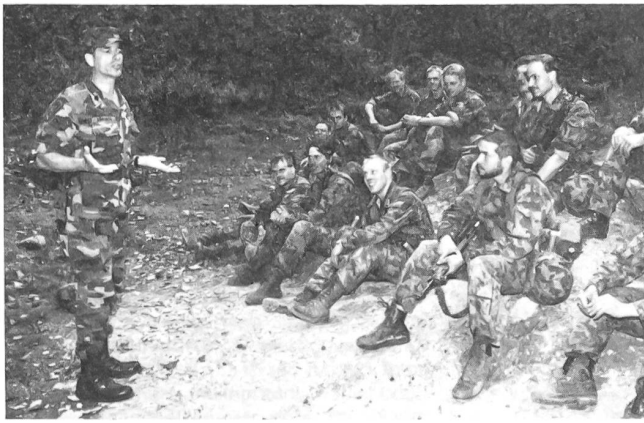
Lobende Worte von Sergeant Major Horvath nach dem Gefechtseinsatz. «Mit Ihnen, meine Herren, würde ich jederzeit irgendwo in Einsatz gehen.»