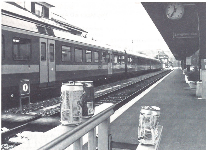
Getrennt gesammelt und entsorgt werden bei der Sihltal-Zürich-Uetliberg-Bahn die anfallenden Abfälle inkl die Alu-Getränkedosen. Dabei rechnet man mit einer Rücklaufquote der Alu-Getränkedosen von 80 bis 90 Prozent. Beim Recycling von Aluminium werden 95 Prozent der ursprünglich eingesetzten Energie eingespart, die Rohstoffreserven geschont und die Abfallmenge reduziert. Über 30 Prozent des auf dem Markt befindlichen Aluminiums stammt heute bereits aus Sekundäraluminium.

Besonders grosse Schwierigkeiten bereitete der Abtransport der nicht gehfähigen Verwundeten beider Seiten, für die jeweils zwei Mann über den verschneiten Felsabstieg bis zu der ursprünglichen Sicherungsstellung des II. Zuges mehrere Stunden und von dort auf dem Anmarschweg der Kompanie bis zum vorgeschobenen Verbandplatz nochmals zwei Stunden brauchten. Akjas oder Schlitten waren in dem Steilgelände nicht zu gebrauchen. Der Abtransport sämtlicher Verwundeten vom Verbandplatz bis zum Hospiz nahm drei Tage in Anspruch.