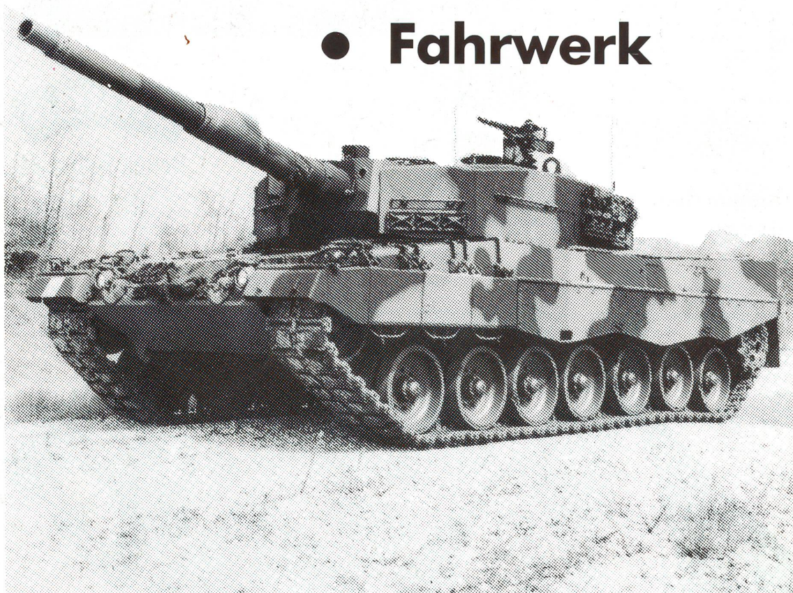
Pz. 87 Leopard 2