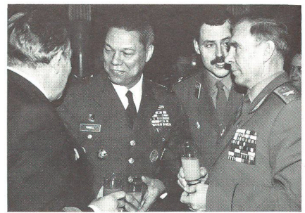
Admiral Dieter Wellershoff (ganz links), General Colin Powell (Mitte) und Armeegeneral Michail Moisejew (ganz rechts).

Drei Wochen lang diskutierten führende Militärs aus den 35 KSZE-Staaten über Militärdoktrinen und Sicherheitskonzeptionen im Jänner hinter verschlossenen Türen in Wien. Dieses neuartige Treffen sollte dazu beitragen, das gegenseitige Verständnis zwischen Ost und West zu fördern und sicherheits- und vertrauensbildende Massnahmen zu stärken. Die stets allgemeinen Gesichtspunkte der Chefs der jeweiligen Generalstäbe wurden durch detaillierte Darlegungen anderer Militärs und Experten aus den Stäben ergänzt.