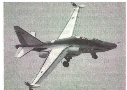
SU-25 FROGFOOT – beachte den langen, ungepfeilten Flügel mit den aerodynamischen Bremsen an den Flügelen.