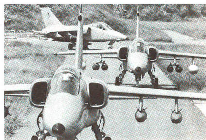
AMX - ein leichtes Erdkampfflugzeug, das von Brasilien und Italien gemeinsam gebaut wird. Der einstrahlige Hochdecker mit kleinen runden Luftenläsers führt an den Flügelspitzen Lenkwaffen mit.

In der Schweiz wird die Erdkampffrolle weiterhin durch den HUNTER erfüllt. Ein Teil der Flotte wurde vor Jahren mit der Luft-Boden-Lenkwanne MAVERICK ausgerüstet. Ein Teil dieser Maschinen soll nach heutiger Planung bis Ende der neunziger Jahre in der Angriffsrolle Dienst tun.