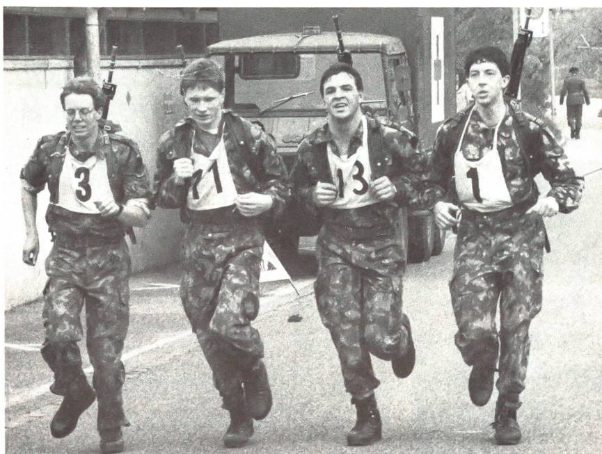
«Nur noch 20 Meter, und wir sind im Ziel!»