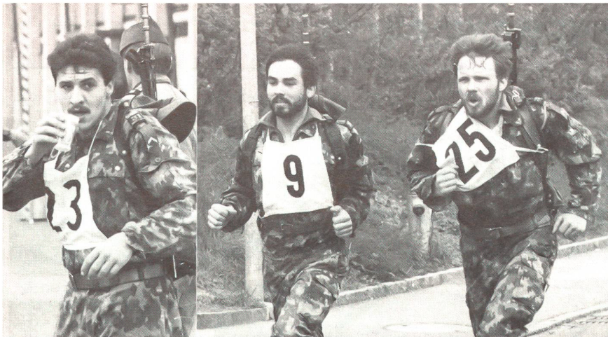
Auch beim Crosslauf mit Sturmpackung gaben alle Aspiranten ihr Bestes.

(mit Waffenlaufpackung und felddiensttauglichem Schuhwerk) zu absolvieren.