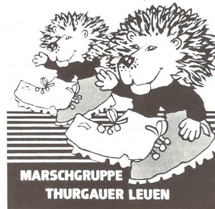
Die lose «Marschgruppe Thurgauer Leuen» formierte sich am 24. März zu einem neuen Verein.

Am Samstag, den 24. März, kam es in der Ratsherrenstube des «Eigenhofs» in Weinfelden zu einer historischen Vereinsgründung. Die anwesenden Mitglieder einer bisher losen Gruppierung gründeten einen neuen thurgauischen Verein: die «Marsch-