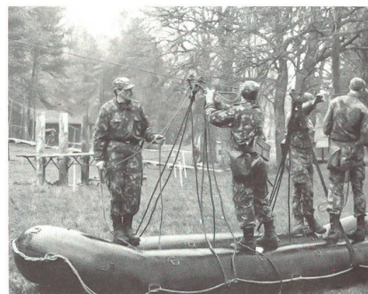
Die letzten Vorbereitungen für die Probefahrt mit der «Seilbahn», dem Schlauchboot M6.