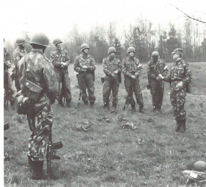
Besprechung und Übungskritik des Häuserkampfes durch den Zfhr; um den Besuchern die Grfhr besser zu visualisieren, tragen diese eine weisse Armbinde.