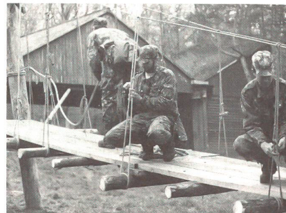
Überprüfung und Streckung der Knoten beim Seilsteg