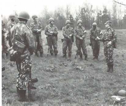
Besprechung und Übungskritik des Häuserkampfes durch den Zfhr; um den Besuchern die Grfhr besser zu visualisieren, tragen diese eine weisse Armbinde.