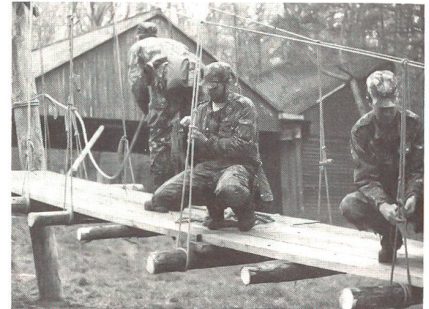
Überprüfung und Streckung der Knoten beim Seilsteg