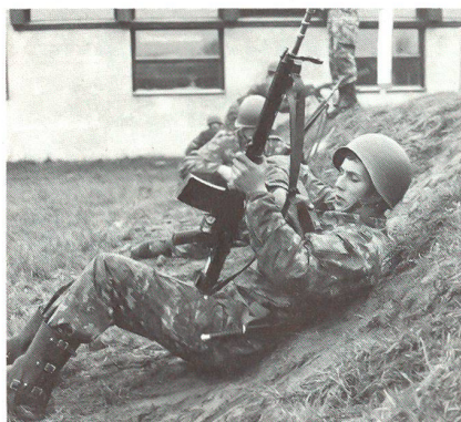
Drill auf dem Gefechtsparcour