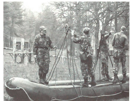
Die letzten Vorbereitungen für die Probefahrt mit der «Seilbahn», dem Schlauchboot M6.