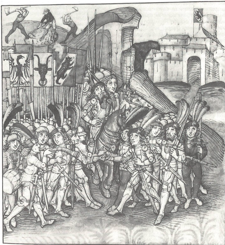
Nach der Schlacht: Die Besatzung von Laupen wird befreit. Aus Schillings Spiezer-Chronik. Das Bild zeigt in der Mitte Rudolf von Erlach zu Pferd, ferner die Fahnen von Weissenburg, Haslital, Uri, usw.

Sicher ist, dass die bernischen Angaben über die Stärke des feindlichen Heeres mit 24 000 bis 30 000 Mann weit übertrieben sind. In Ansehen, dass der Gegner während der Schlacht noch starke Kräfte zur Blockierung der Stadt Laupen zurücklassen musste, dürften auf dem Schlachtfeld sich ungefähr gleiche Kräfte in der Grössenordnung von je 5000 bis 6000 Mann gegenüberstanden haben, auf gegnerischer Seite allerdings mindestens einige hundert vollgerüstete Ritter.