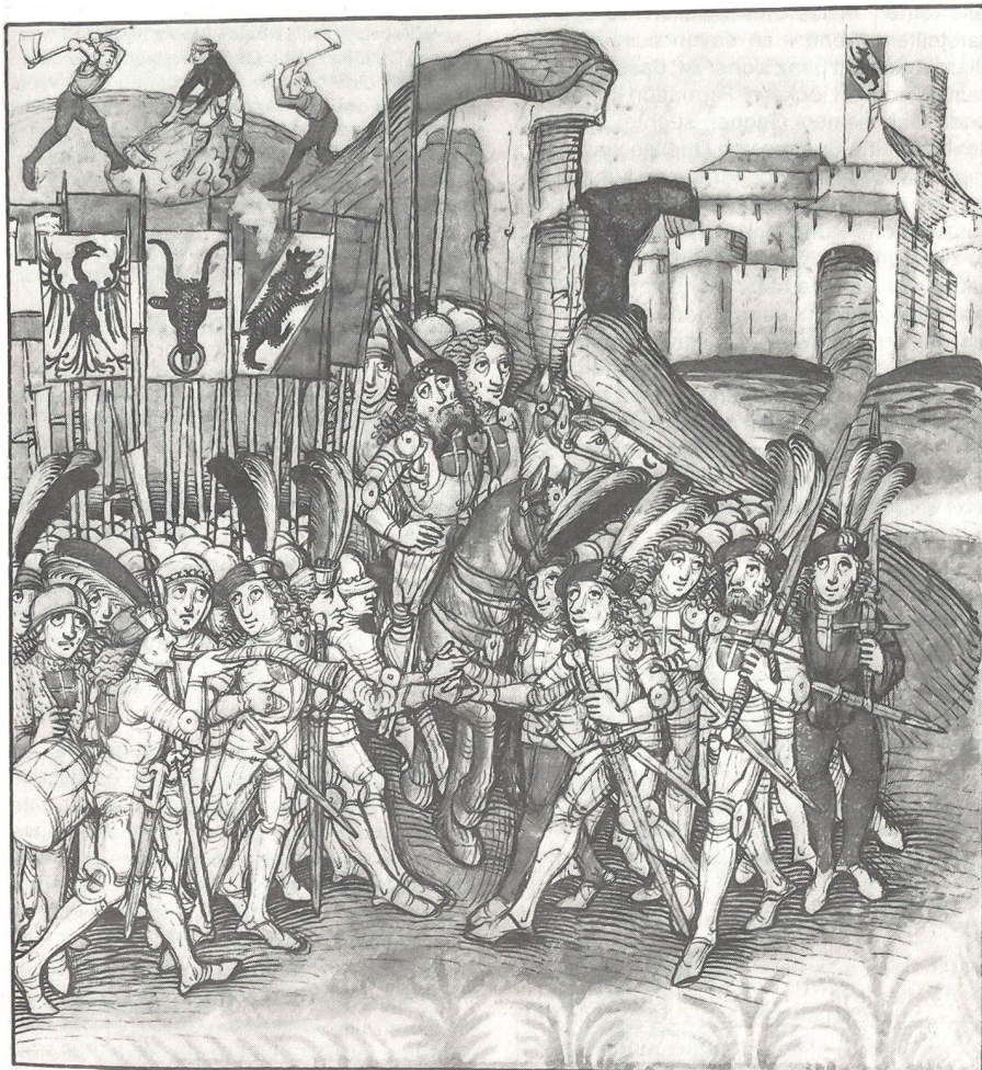
Nach der Schlacht: Die Besatzung von Laupen wird befreit. Aus Schillings Spiezer-Chronik. Das Bild zeigt in der Mitte Rudolf von Erlach zu Pferd, ferner die Fahnen von Weissenburg, Haslital, Uri, usw.

Sicher ist, dass die bernischen Angaben über die Stärke des feindlichen Heeres mit 24 000 bis 30 000 Mann weit übertrieben sind. In Ansehen, dass der Gegner während der Schlacht noch starke Kräfte zur Blockierung der Stadt Laupen zurücklassen musste, dürften auf dem Schlachtfeld sich ungefähr gleiche Kräfte in der Grössenordnung von je 5000 bis 6000 Mann gegenübergestellt haben, auf gegnerischer Seite allerdings mindestens einige hundert vollgerüstete Ritter.