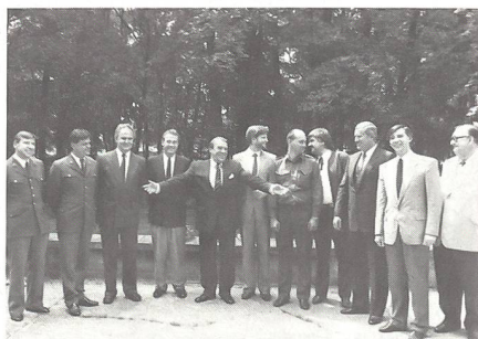
Bundesminister Dr Robert Lichal (Bildmitte) mit den Angehörigen des Milizbeirates bei dessen Konstituierung.

1988 verabschiedete das österreichische Parlament eine Novelle zum Bundesverfassungsgesetz, womit das «Milizsystem» für das Bundesheer verankert