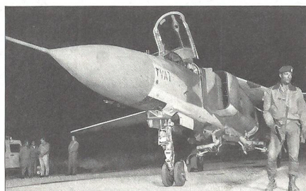
Die syrische MiG 23 wird von israelischem Grenzschutz bewacht.