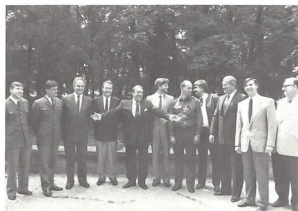
Bundesminister Dr Robert Lichal (Bildmitte) mit den Angehörigen des Milizbeirates bei dessen Konstituierung.

1988 verabschiedete das österreichische Parlament eine Novelle zum Bundesverfassungsgesetz, womit das « Milizsystem » für das Bundesheer verankert