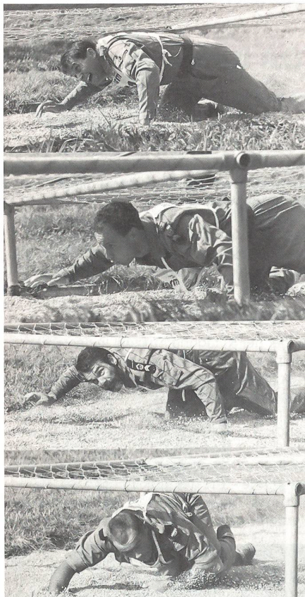
Stilstudien unter dem Kriechnetz