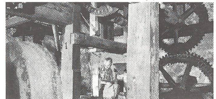
In der alten Ölmühle