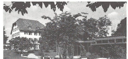
Gasthof Schloss Böttstein und Ausstellungspavillon