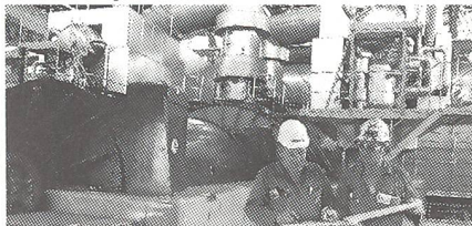
Im Maschinensaal des Kernkraftwerkes