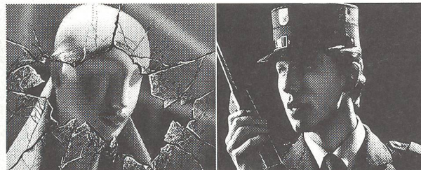
Auch das macht ein Securitas:

Könnte es Ihnen nicht auch Freude machen, Fachmann für Sicherheit zu sein? Dann würden wir uns gerne mit Ihnen darüber unterhalten. Denn uns fehlen noch einige Kollegen.