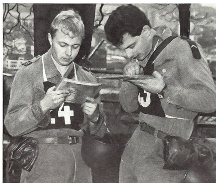
Start vom Hexenplatz am Bruggerberg zum 12-km-Marsch.

Das kalte Wasserbad kam für die 36 Aspiranten gleich nach der Begrüssung durch den Schulkommandanten. Da gab es weder Theorie, noch Kasten-einträumen oder Materialfassen. Nullkommapfölich waren Eigeninitiative, Zuverlässigkeit, Selbständigkeit, Einsatzfreude und Wille zu forcierter Leistung gefragt – und das «auf Zeit» . Das von jedem zu fassende persönliche Material lag übersichtlich ausgebreitet auf den Betten. An einer Wandtafel stand der Befehl für die Übung «Furioso» . Es hiess blitzartig «Tenü blau» erstellen, Helm auf, Sturmgewehr umhängen – und ab, Richtung Bruggerberg, zum Hexenplatz. Hier war der Start. «Karte fassen, Marschrichtung zum nächsten Posten eruieren – und sofort weg!» In der Nähe vom Rüfenacher Waldhaus gab's ein HG-Werfen, im Itelentäli zur Stärkung ein «Frei-luftmittag» , im Kräthal kam das Sturmgewehr «zum Zug» , und nach dem rund 12 Kilometer langen Marsch hiess es – «hopp, hopp!» – im Brugger Schachen noch einen Teil der Kampfbahn zu bewältigen. Nicht alle schafften das letzte Hindernis, die Bretterwand, im ersten Anlauf. Spätestens hier wurde auch dem letzten der 36 Aspiranten klar: «Jetzt bin ich in der Offiziersschule – und das ist alles andere als ein Sonntagsspaziergang» .