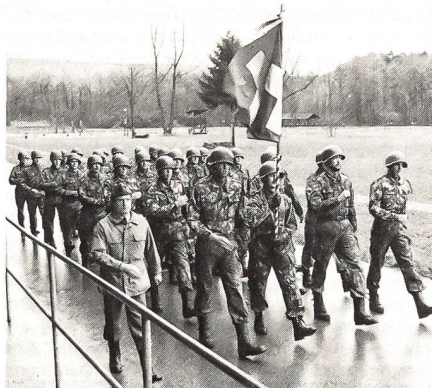
Aufmarsch vor der Schachentribüne

Die Jubiläumsfeier, die mit der durch das Spiel eines Infanterieregiments intonierten Nationalhymne begonnen hatte, schloss mit der Ehrensalue durch ein Kontingent der Freiburger Grenadiere.