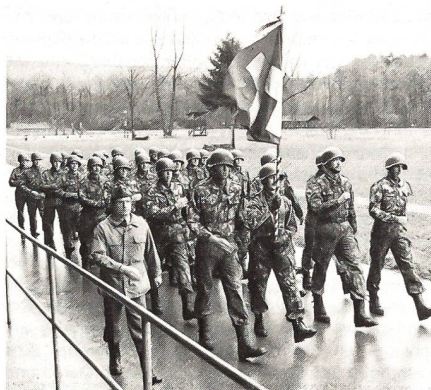
Aufmarsch vor der Schachentribüne

Die Jubiläumsfeier, die mit der durch das Spiel eines Infanterieregimentes intonierten Nationalhymne begonnen hatte, schloss mit der Ehrensalue durch ein Kontingent der Freiburger Grenadiere.