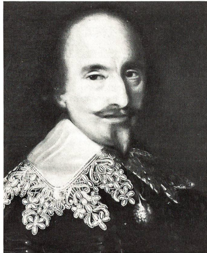
Herzog Heinrich Rohan, nach einem Gemälde im Besitze des Rätischen Museums Chur.

Als sich seine beiden Gegner im Frühsommer in Bewegung setzten, Fernamont vom Münstertal gegen Bormio und Serbelloni Veltlin aufwärts, da zog sich Rohan mit einer schnellen Bewegung nach dem Oberengadin-Chiavenna geschickt aus der Schlinge. Weil die geplante Zange nichts zu fassen bekam, begab sich Fernamont ins Livigno, wo ihn am 27. Juni Rohan nach raschem nächtlichem Marsch über den Casanapass (2694 m) überfiel und in die Flucht schlug. Schon am 3. Juli besiegte er ihn ein zweitesmal bei Mazzo an der Adda, etwa 8 Kilometer talaufwärts von Tirano, derweil Serbelloni unweit Sondrio passiv in einer Sperrstellung verharrte. Rohan wandte sich unverzüglich gegen diesen, wel-