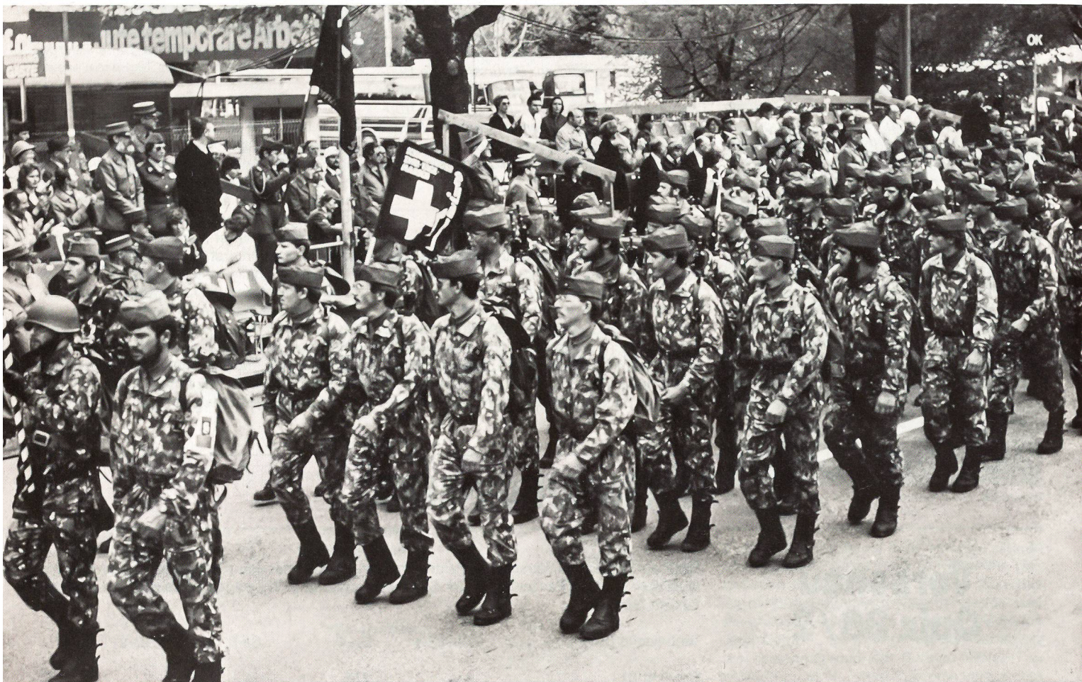
Eine Marschgruppe der Schweizer Armee beim Einmarsch vor der Gästetribüne beim Eisstadion Allmend.

Die Einladung zur Teilnahme am Schweizerischen Zwei-Tage-Marsch stellt die Mannschaft der Bundeswehr aus Freiburg im Breisgau immer wieder vor die Aufgabe, jedes Jahr eine leistungsstarke Gruppe zusammenzustellen. Auch 1988 beim 29. «Zwei-Tägeler» wird die internationale Marschveranstaltung in Bern wieder ein Höhepunkt der Marschierer aus aller Welt sein, militärsporthliche Gruppen und zivile Wanderer kommen nach Bern im Herzen Europas.