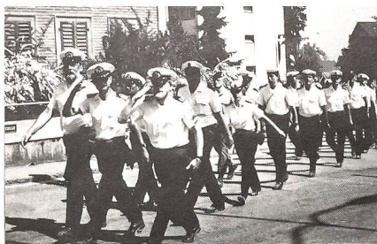
Die Marschgruppe der Königlich Niederländischen Marine aus Den Helder in Münchenbuchsee beim 28. Schweizerischen Zwei-Tage-Marsch.