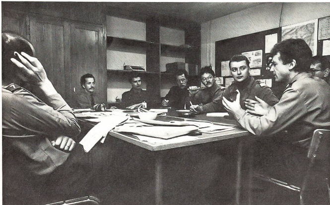
Die täglichen Redaktionssitzungen sind engagiert. Die Journalisten streiten sich um die Texte, der Fotograf kämpft um seine Bilder und ...

Fazit: Unbekanntem am Telefon grundsätzlich keine Auskunft geben. Immer Name, Ort und Telefonnummer verlangen. Abhängen und zurückrufen. Fangfragen stellen («gemeinsame Bekannte»). Sich bei einer Vertrauensperson über den Anrufer erkundigen. Selber Fragen stellen und nicht antworten. Nicht nur das Auge, auch das Gehör muss trainiert sein.