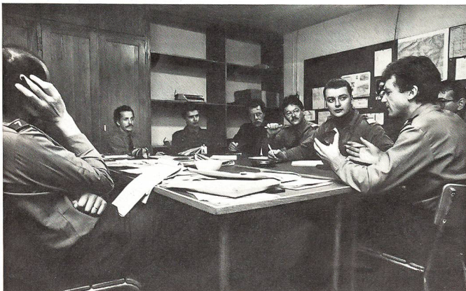
Die täglichen Redaktionssitzungen sind engagiert. Die Journalisten streiten sich um die Texte, der Fotograf kämpft um seine Bilder und ...

Fazit: Unbekannten am Telefon grundsätzlich keine Auskunft geben. Immer Name, Ort und Telefonnummer verlangen. Abhängen und zurückrufen. Fangfragen stellen («gemeinsame Bekannte»). Sich bei einer Vertrauensperson über den Anrufer erkundigen. Selber Fragen stellen und nicht antworten. Nicht nur das Auge, auch das Gehör muss trainiert sein.