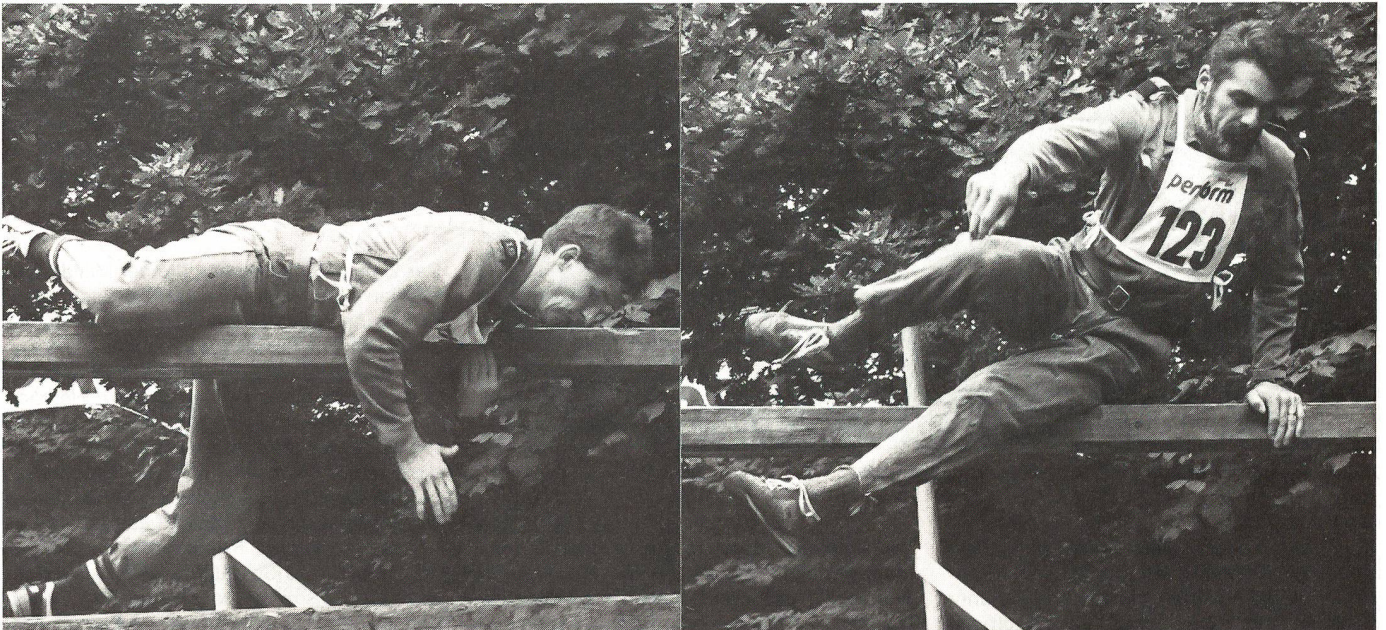
Wie geht's am schnellsten? Jeder hat seine eigene Technik.