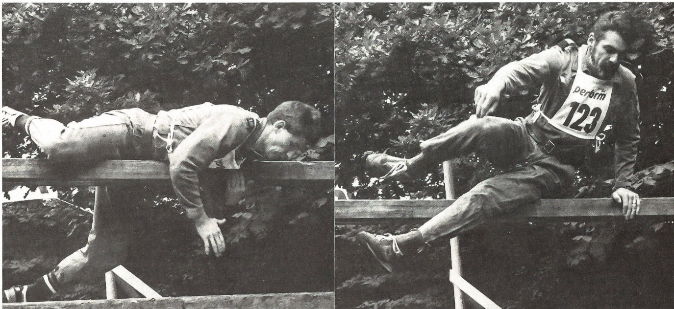
Wie geht's am schnellsten? Jeder hat seine eigene Technik.