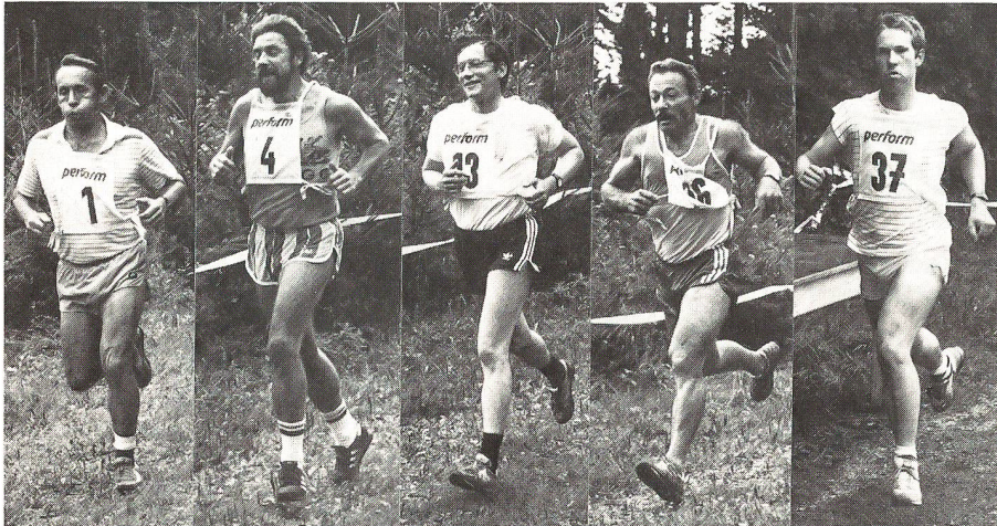
Stilstudien: Beim 4000-m-Geländelauf auf dem Bruggerberg.

Im Bewusstsein, dass Ausbilder auch Vorbilder sein sollten, rief die Sektion ausserdienstliche Tätigkeit vom Stab der Gruppe für Ausbildung 1981 die hauptberuflichen Ausbilder aller Truppengattungen und Altersstufen zur freiwilligen Teilnahme an einem Sommermehrkampf für Instrukturen nach Brugg auf. Dieses Jahr fand – wiederum auf dem Waffenplatz der Garnisonsstadt am Wassertor der Schweiz – bereits die 8. Auflage des «Polyathlon d'été pour instructeurs» statt. Für 44 der 147 Wettkämpfer war diesmal die Teilnahme «Befehl». Es sind Absolventen der in Herisau stationierten Instrukturenschule.