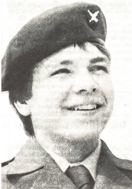
Schüler der Ungarischen Militär-Mittelschule in seiner Uniform

Um die Nachwuchssorgen hinsichtlich des Berufsoffiziersstandes der Volksarmee zu mildern, wurde im vergangenen Jahr in Ungarn die zehnte Militär-Mit-