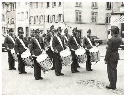
Bildlegende: Tambourengruppe des Brigadespiels in den Strassen des ehrwürdigen Städtchens Diesenhofen am Rhein im Kanton Thurgau.

Die Gz Br 6 führte in ihrem EK grössere Truppenübungen durch. Doch das Spiel hatte eine andere Zielsetzung, es musste sich in sehr kurzer Zeit und an langen Arbeitstagen auf mehrere Platz- und Galakonzerte vorbereiten. 40 Prozent des Repertoires