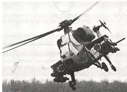
A-129 MANGUSTA (NATO)