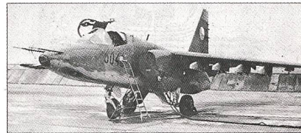
Su-25 FROGFOOT (WAPA)

Als Gegenstück zur A-10 THUNDERBOLT II der Amerikaner verfügen verschiedene WAPA-Staaten über die ebenfalls mit einer mittelkalibrigen Bordkanone hoher Durchschlagsleistung ausgerüstete Su-25 FROGFOOT. Bereits in grossen Stückzahlen im Einsatz stehen Panzerabwehrhelikopter der Typen Mi-24 HIND und Mi-8 HIP. Dem Vernehmen nach sollen diese beiden Typen in allernächster Zeit durch zwei weitere Helikoptermuster ergänzt – und vermutlich teilweise ersetzt – werden.