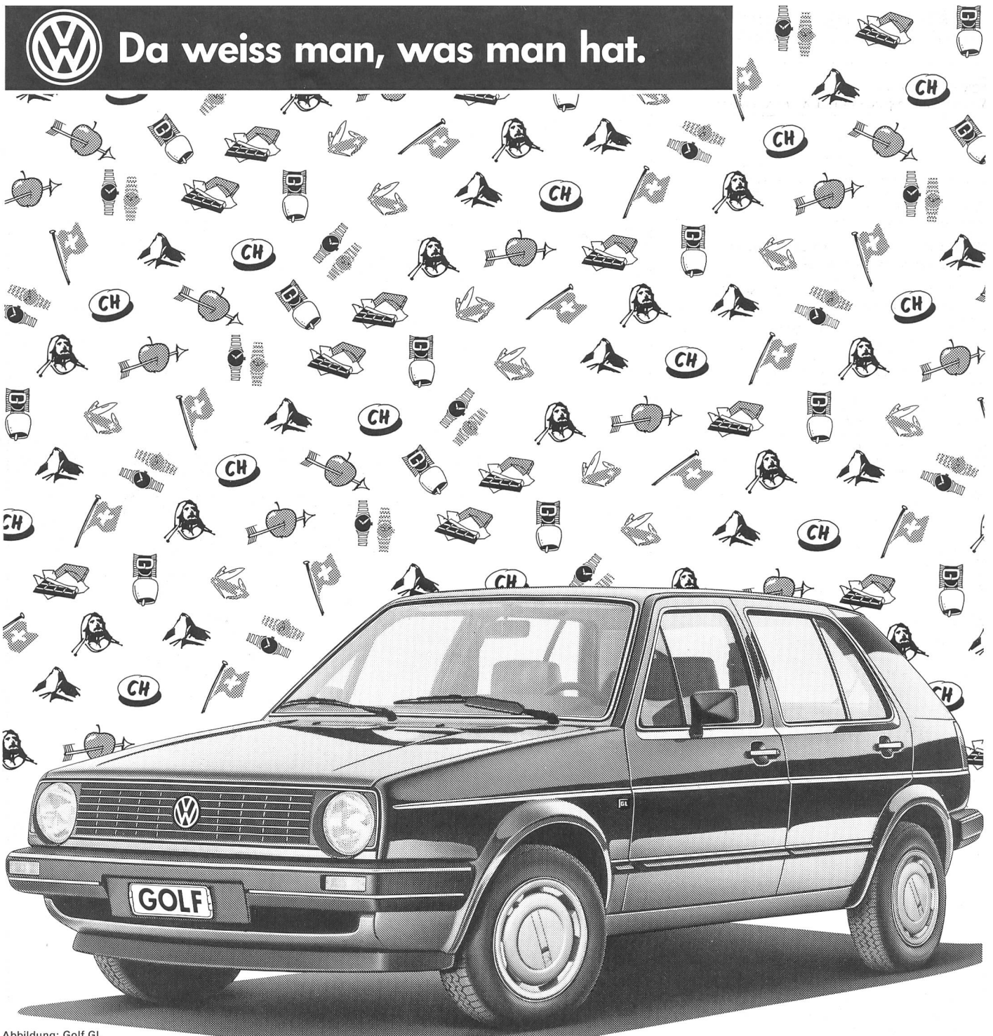
Abbildung: Golf GL