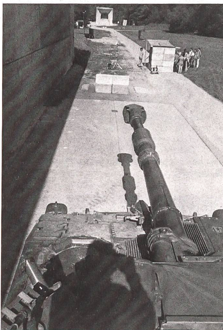
Bild: Ein Beispiel aus der Tätigkeit der GRD. Mit modernsten Methoden wird versucht, den bisher unbekannteren Ursachen der Geschoss-Streuung bei der Artillerie auf die Spur zu kommen. Mit einem Geschütz der Panzerartillerie werden Geschosse abgeschossen. Nach einer Flugstrecke von 20 Metern wird die Deformation des Geschosses (eine Schlüsselgrösse für die Streuung), fotografisch festgehalten.

Um mit der raschen Entwicklung der modernen Kriegstechnik mithalten zu können, betreibt die Gruppe für Rüstungsdienste des Bundes eine aktive Forschungstätigkeit.