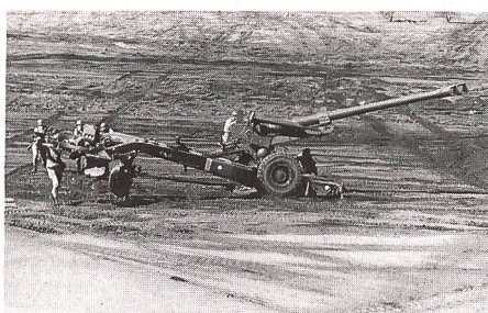
Reservisten kehren zu Wehrübungen wieder zurück und dienen an der Waffe, hier Feldhaubitze 70.