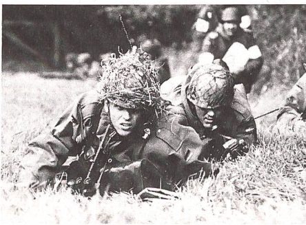
Am Anfang des Grundwehrdienstes steht die infanteristische Ausbildung.

Als erste Verbesserungsmaßnahmen wurden alle Kommandeure durch Befehle der Inspektoren angewiesen, die Reservistenarbeit mit Nachdruck einzubeziehen und zu fördern. Als Massnahmen zur Verbesserung von Motivation und Betreuung sowie zur Stärkung des inneren Zusammenhalts sollen einzelne Reservisten zu Veranstaltungen herangezogen werden, nunmehr auch Reservisten die Spitzendienstgrade der Unteroffiziere (Stabs-/Oberstabsfeldwebel) erreichen und Offiziere der Reserve zur Beförderung zum Oberst vorgeschlagen werden können.