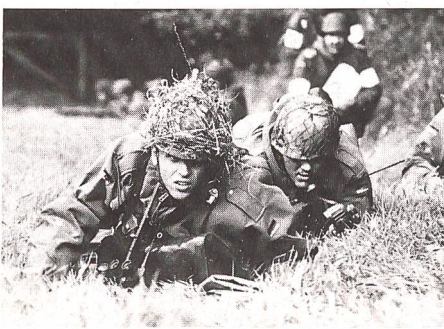
Am Anfang des Grundwehrdienstes steht die infanteristische Ausbildung.

Als erste Verbesserungsmaßnahmen wurden alle Kommandeure durch Befehle der Inspektoren angewiesen, die Reservistenarbeit mit Nachdruck einzubeziehen und zu fördern. Als Massnahmen zur Verbesserung von Motivation und Betreuung sowie zur Stärkung des inneren Zusammenhalts sollen einzelne Reservisten zu Veranstaltungen herangezogen werden, nunmehr auch Reservisten die Spitzendienstgrade der Unteroffiziere (Stabs-/Oberstabsfeldwebel) erreichen und Offiziere der Reserve zur Beförderung zum Oberst vorgeschlagen werden können.