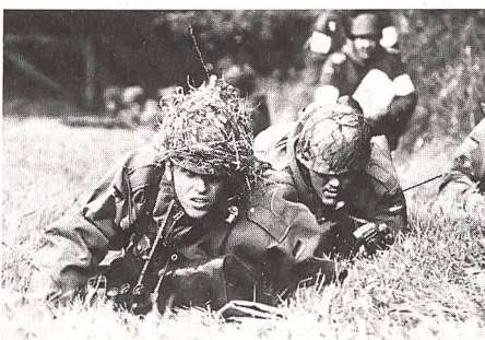
Am Anfang des Grundwehrdienstes steht die infanteristische Ausbildung.

Als erste Verbesserungsmassnahmen wurden alle Kommandeure durch Befehle der Inspektoren angewiesen, die Reservistenarbeit mit Nachdruck einzubeziehen und zu fördern. Als Massnahmen zur Verbesserung von Motivation und Betreuung sowie zur Stärkung des inneren Zusammenhalts sollen einzelne Reservisten zu Veranstaltungen herangezogen werden, nunmehr auch Reservisten die Spitzendienstgrade der Unteroffiziere (Stabs-/Oberstabsfeldwebel) erreichen und Offiziere der Reserve zur Beförderung zum Oberst vorgeschlagen werden können.