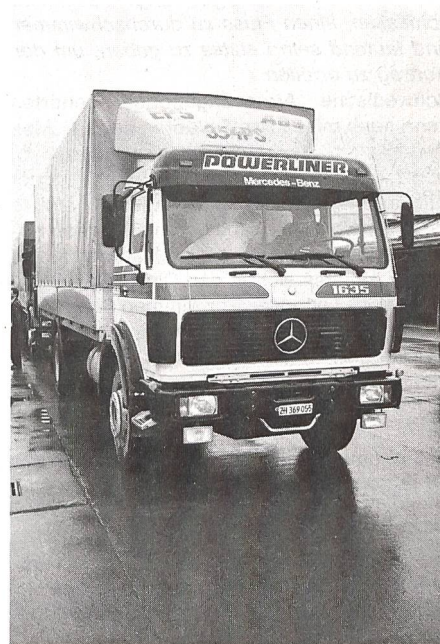
... und das Fahrzeug ist bereits zum Einsatz unterwegs.