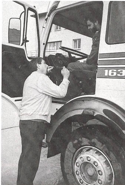
Der Halter eines zivilen Fahrzeuges erklärt dem militärischen Motorfahrer innerhalb kurzer Zeit die Funktionen...