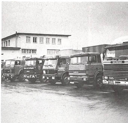
Fahrzeuge aus zivilen Beständen wurden zur Schau gestellt ...