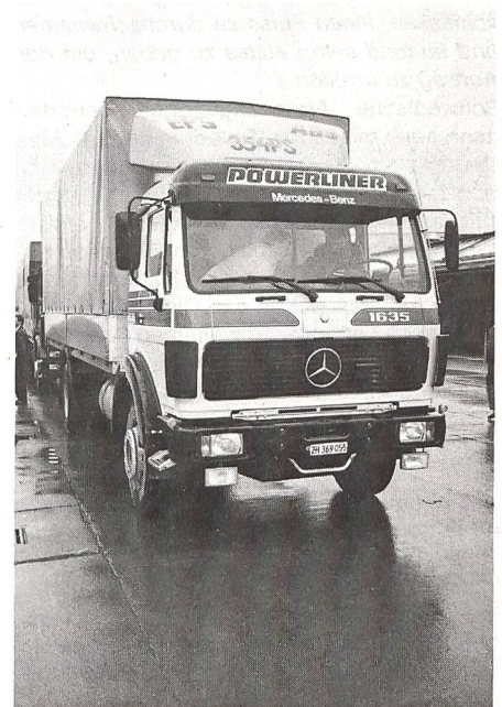
... und das Fahrzeug ist bereits zum Einsatz unterwegs.