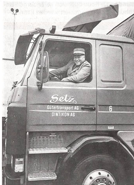
Oberst Andreas Aeberhard, Chef der Sektion Motorfahrzeugrequisition im BATT, für einmal auf einem zivilen «Bock».

Anfangs August 1914 kam das «Freiwilligen-Automobilkorps» im Rahmen des Aktivdienstes zu seinem ersten Ernstfalleinsatz. Dabei wurden die Fahrzeuge auf den Depotplätzen Bulle, Burgdorf, Cham und Genf gestellt. Der Bedarf an motorisierten Transportmitteln stieg in den ersten zwei Kriegsjahren um 200 und bis zum Kriegsende 1918 auf 2200 Fahrzeuge an. Bald einmal erwies sich, dass für die Abdeckung dieses erhöhten Motorisierungsgrades eine zentrale Übersicht über den Fahrzeugbestand in der Schweiz unerlässlich war, zumal in mehreren Kantonen Hunderte von Autos auf den offiziellen Listen fehlten. Der Bundesrat erliess deshalb am 23. Februar 1917 eine «Verordnung betreffend die Meldepflicht», der die Besitzer verpflichtete, Kauf