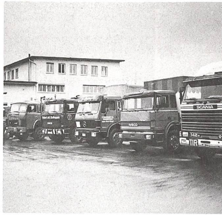
Fahrzeuge aus zivilen Beständen wurden zur Schau gestellt ...