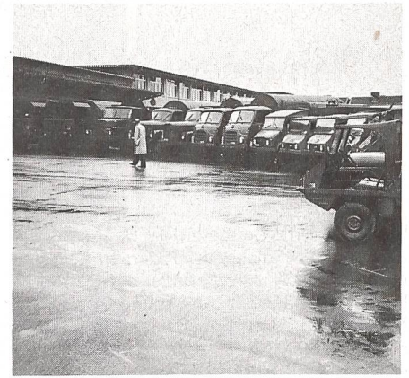
... wie auch armee-eigene Transportmittel.