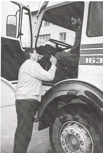
Der Halter eines zivilen Fahrzeuges erklärt dem militärischen Motorfahrer innerhalb kurzer Zeit die Funktionen ...