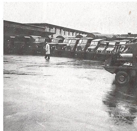
... wie auch armee-eigene Transportmittel.