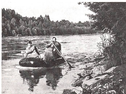
Die Kaderübung «Jagdkampf im Jura» zeigte, dass nur ein gut trainierter Unteroffizier in der Lage ist, in physischen Stresssituationen ...

mern des Vereines besucht und hatte zum Ziel, die Unteroffiziere im Führen unter physischer Belastung zu schulen sowie in den Elementen des Jagdkampfes weiterzubilden.