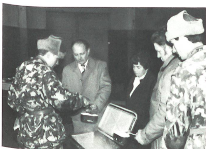
Das währschafte Pot-au-feu aus der Kochkiste mündete Zivilisten und Militär.

Diese RS absolvierte die Grundausbildung das letzte Mal unter provisorischen Bedingungen. Für die am 14. Juli beginnende Sommer-RS werden die neue Kaserne und militärischen Anlagen im «Auenfeld» zur Verfügung stehen. Teilweise erfolgte die Ausbildung bereits in der Frühjahrs-RS in den neuen Bauten. Am Besuchstag bestand die Möglichkeit zu deren Besichtigung. Die offizielle Einweihung wird am 26. September erfolgen mit anschliessendem Tag der offenen Tür am 27. September.