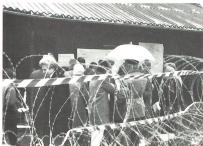
Der Zutritt zur Nachrichtenzentrale wurde gefechtsmässig mit Drahtverhau geschützt.

um auch den infanteristischen Einsatz zu üben. Dies ist zur Heranbildung der Wehrmänner zur Kriegstüchtigkeit unerlässlich.