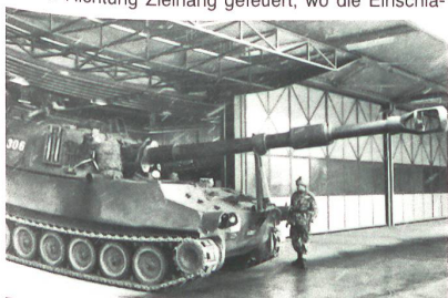
Eine Pz Hb einsatzbereit in der neuen Gesch Halle. Techn. Daten: Gef Gew 25,5 t, Leer Gew 22,8 t, Länge 9,05 m, Breite 3,18 m, Höhe 3,2 m, max Schussdistanz 17 km, Besatzung 1 Kdt, 1 Fhr, 6 Kan.

Fachdienstliche Demonstrationen und Vorführungen waren im Tagesbefehl auf den Vormittag festgelegt. Leitungsbaue, Herstellen von Verbindungen, Versorgung mit Treibstoff standen auf dem Programm. Zu besichtigten waren Fahrzeuge und Geräte, Arbeitsabläufe und Einzelsätze konnten aus nächster Nähe beobachtet und verfolgt werden, selbstverständlich immer fachkundig kommentiert. Für die Ausbildung im Verband wird die Schule umorganisiert zu einer WK-mässigen Abteilung. Als solche hat sie eine Standarte, die in einem eindrucksvollen militärischen Zeremoniell übernommen wurde. Der Schuldt bezeichnete sie als Zeichen der Freiheit, die es zu verteidigen gilt. Höhepunkt des Besuchstages ist zweifelsohne die gross angelegte Schiessdemonstration mit den Pz Hb im Raume Allmend. Aus ihrer Bereitstellung führen die drei Gesch Btr auf Kommando kriegsmässig in ihre Stellungen. Erstaunlich ist, wie die mit Gefechtsge- wichten von 25,5 Tonnen, Länge 9,05 und Breite 3,18 Meter, 15,5 cm Hb, nach einer relativ kurzen Ausbildungszeit, präzise in Stellung manövriert werden. Kaum aufgeföhren, wurden schon die ersten Salven Richtung Zielhang geföhrt, wo die Einschlä-