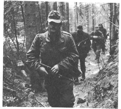
Jagdkämpfer des österreichischen Bundesheeres beim Marsch durch einen Gebirgswald ins Einsatzgebiet.

Eine der grössten Übungen in der 30jährigen Geschichte des österreichischen Bundesheeres wurde vom 6. bis 17. Oktober 1986 in der Steiermark durchgeführt. Rund 23 000 Soldaten – über den gesamten Übungszeitraum verteilt waren es sogar über 30 000 –, etwa 5000 Räderfahrzeuge, etwa 300 gepanzerte Fahrzeuge sowie Jagdbomber, Flächenflugzeuge und Hubschrauber nahmen daran teil und übten Verteidigung, Jagdkampf, Fliegerabwehr und Mobilmachung. Soldaten aus allen Bundesländern – in der Masse Milizsoldaten – waren in der Ober- und Oststeiermark eingesetzt, auch die angrenzenden Bezirke der Bundesländer Salzburg, Kärnten und Burgenland waren