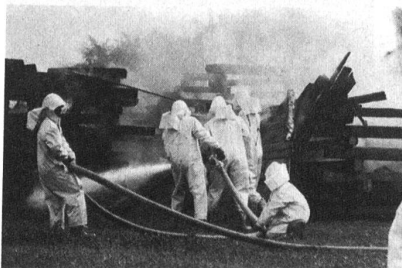
Eindrucksvolle Demonstration der Luftschutztruppen.

Die mit Küchenchefs beider Basel sorgten für das leibliche Wohl der Besucher, und die eingesetzte Feldbäckerei meldete einen Rekordumsatz von 1040 Kilogramm «Ordonnanz-Brot».