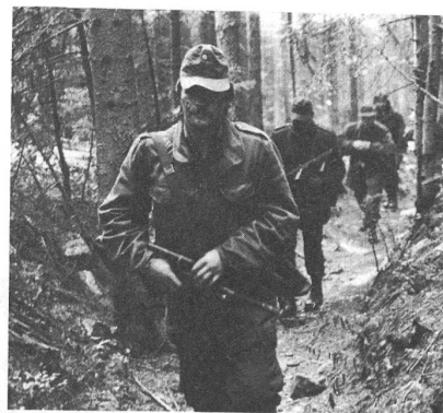
Jagdkämpfer des österreichischen Bundesheeres beim Marsch durch einen Gebirgswald ins Einsatzgebiet.

als Übungsräume miteinbezogen. Der «Schweizer Soldat» berichtet im Januar 1987 mehr über diese Übung.