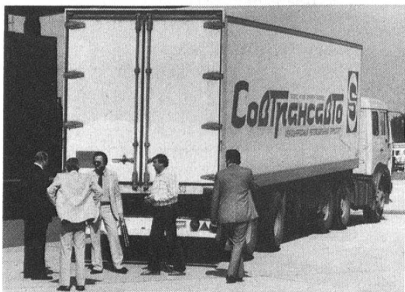
Sowjetrussischer Lastwagen bei der Kontrolle durch die schweizerischen Zollbehörden.

terung sein müssen, ergeben in ihrer Vielzahl, von geschulten und speziell dafür ausgebildeten militärischen Fachleuten ausgewertet und analysiert, ein aktualisiertes, permanentes Bild des möglichen Einsatzraumes. Im Osten werden westlichen, auch schweizerischen Lastwagen genaue Strecken vorgeschrieben, während wir solche Fahrzeuge frei zirkulieren lassen.