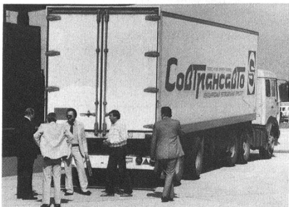
Sowjetrussischer Lastwagen bei der Kontrolle durch die schweizerischen Zollbehörden.

terung sein müssen, ergeben in ihrer Vielzahl, von geschulten und speziell dafür ausgebildeten militärischen Fachleuten ausgewertet und analysiert, ein aktualisiertes, permanentes Bild des möglichen Einsatzraumes. Im Osten werden westlichen, auch schweizerischen Lastwagen genaue Strecken vorgeschrieben, während wir solche Fahrzeuge frei zirkulieren lassen.