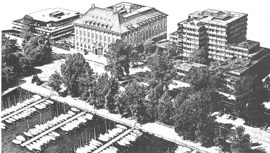
Geschäftsgebäude der Schweizer Rück am Zürichsee, nahe dem Stadtzentrum

Personalabteilung Postfach, 8022 Zürich Telefon 01/208 21 21