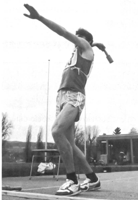
Beim Frühjahrs-Dreikampf in Steckborn musste mit dem Wurfkörper ein kleines Ziel in 20 Meter Entfernung getroffen werden.

Der UOV Bischofszell plant ein eigenes Klublokal mit Materialmagazin. Eine Holzbaracke, die kostenlos übernommen werden kann, soll in Fronarbeit aufgebaut werden und 24 Personen Platz bieten.