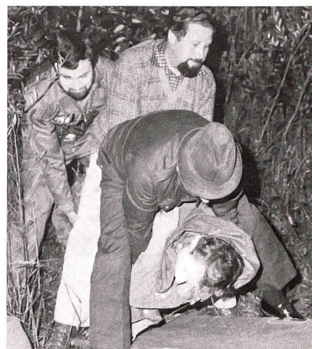
Auch das Bergen der «Verletzten» gehörte zur wirklichkeitsnahen Spreng- bzw Sanitätsübung des UOV Bischofszell.

ren die Mitarbeit bei den Schweizerischen Artillerietagen und beim Jubiläum «50 Jahre Frauenfelder Militärwettmarsch und 50 Jahre Thurgauer Militärtrömpeter». Weil daneben die Mitgliederwerbung nicht ganz die gewünschten Erfolge zeigte, wird zu vermehrter Aktivität in dieser Richtung aufgerufen, besonders im Hinblick auf die SUT 85 in Chamblon/Yverdon. Daneben ist der Marschgruppenführer des UOV Frauenfeld auf der Suche nach Wehrmännern, die an einer Teilnahme am Berner Zweitagemarsch und am Viertagemarsch von Nijmegen (Holland) interessiert sind.