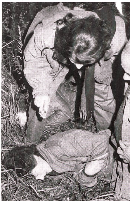
«Hilfe, Hilfe, es hät klöpft!» An der Übung des UOV Bischofszell müssen die «Verunfallten» in der Dunkelheit zuerst gesucht werden.

Von einer Übung besonderer Art berichtet «UOV-aktuell» des UOV Bischofszell . Der Abend begann mit einer Kaderübung «Sprengen» unter der Leitung von Hptm Markus Hauri. Nach einer kurzen Theorie über die Sicherheitsbestimmungen begab man sich anschliessend zum Einsatzort, wo die Übungsteilnehmer von einem dumpfen Knall empfangen wurden. Aus der Dunkelheit tauchte ein wirr sprechender junger Mann mit blassem Gesicht auf. «Hilfe, Hilfe, es hät klöpft, es lieged alli umenand», war seine Begrüssung. Diese geisterhafte Begegnung deutete auf einen Sprengunfall hin, und so wurde im Handumdrehen aus einer Spreng- eine wirklichkeitsnahe Sanitätsübung. Nun konnte getestet werden, wie die UOV-Mitglieder in dieser unerwarteten Situation reagieren würden. Reaktions- und Beurteilungsvermögen, Alarmierung, lebensrettende Sofortmassnahmen sowie Verletztenbetreuung stellten nun die zu lösenden Aufgaben dar. Von einem Bauernhaus aus wurden telefonisch der Samariterverein Bischofszell, der Krankentransportdienst und die Polizei alarmiert. Gleichzeitig richtete man ein Verwundetennest ein. Später wurden noch die Kantonsspitäler Münsterlingen und St.Gallen als Verstärkung angefordert. Zudem half die Feuerwehr, die Unfallstelle zu beleuchten und die Umgebung systematisch nach weiteren Verletzten abzusuchen. Der Präsident des UOV Frauenfeld , Kpl Erich Wehrlin, hält in seinem Jahresbericht Rückblick auf eine Fülle von Aktivitäten im letzten Jahr. Höhepunkte wa-