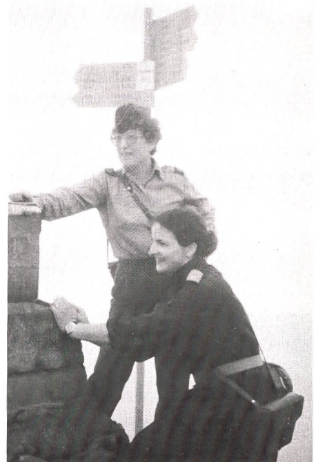
Im Nebel ging's hoch zum Schnebelhorn. «Wenn es schön wäre, sähe man bis zum Bodensee!» Ein schwacher Trost.