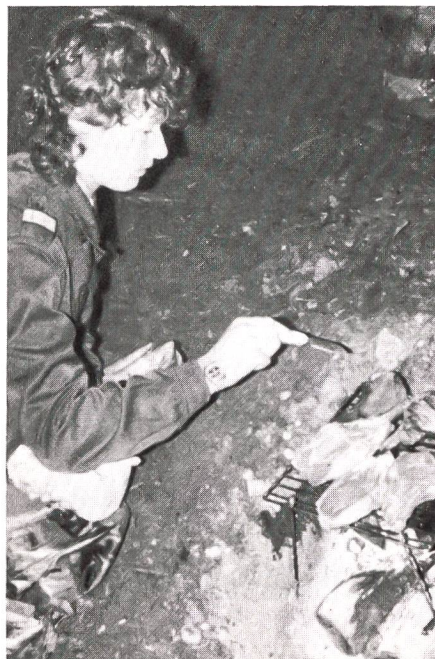
Versuchten wir anfangs beim Geländepunktbestimmen noch vor den ersten Regentropfen zu flüchten, mussten wir oben angelangt endgültig vor dem nun als Dauerregen niederprasselnden nassen Segen kapitulieren. Zwar konnten wir auf der Hirzegg eine für diesen Notfall vorgesehene trockene Unterkunft beziehen, doch gekocht wurde über zwei Grabenfeuern im Freien.