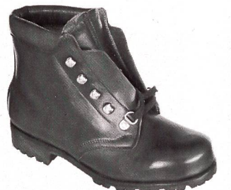
Gleiches Modell braun mit verschiedenen technischen Neuerungen.