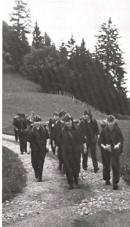
Samstag: Nachdem das nötige Material gefasst war, wurden wir per Pinz vom AMP Bronschhofen zum Älpli verschoben. Noch trockenen Fusses konnten wir den Aufstieg zur Hirzegg in Angriff nehmen.