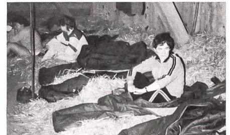
Gegen Mitternacht bezogen wir unser Nachtlager im Stroh. Wer weckte da wohl wen immer wieder? Die bimmelnden und scharrenden Kühe vom untern Stock uns oder die «alles zersägenden» Frauen die Tiere? Sonntag: Punkt 0630 war Tagwacht. Schlafsäcke zusammenrollen, Katzenwäsche, marschbereit machen.