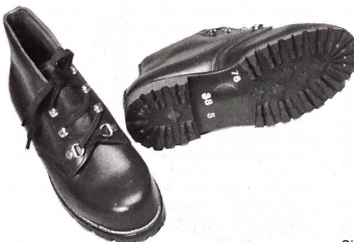
FHD/MFD-Schuh Modell 62 braun.

Die heute im Gebrauch stehenden FHD/MFD-Marsch-Schuhe