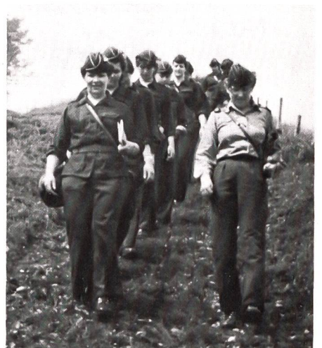
Um so besser schmeckte uns dann das Frühstück. Frisch gestärkt nahmen wir danach den Abstieg nach Ehratsrich unter die Füße, um von dort nach Bronschhofen zurückgebracht zu werden. Schlussbemerkung: Bei schönem Wetter eine durchaus empfehlenswerte Tour!