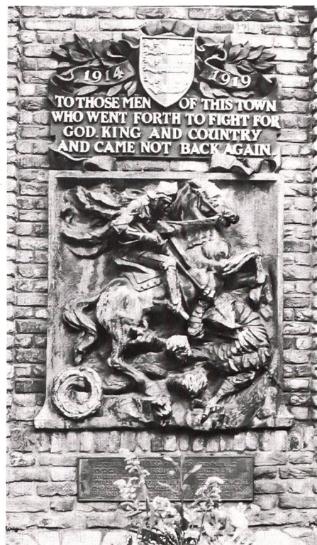
In Erinnerung an die im 1. Weltkrieg gefallenen Soldaten aus der Stadt Dover.