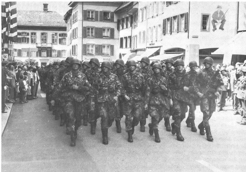
Infanterie-Rekrutenschule 4/84 Vorbeimarsch und Fahnenabgabe am 1. Juni 1984 im Städtchen Liestal

Oberst i Gst Rast: Einen zweifachen Rat: 1. Dass sie den Rekruten als Menschen immer ernst nehmen und im Fordern von Leistungen diesem Rechnung tragen. 2. Dass sie den Mut haben, als Chefs bis zum Schluss aufzutreten und konsequent zu fordern, damit der Auftrag erfüllt werden kann, nämlich Soldaten auszubilden und zu erziehen.