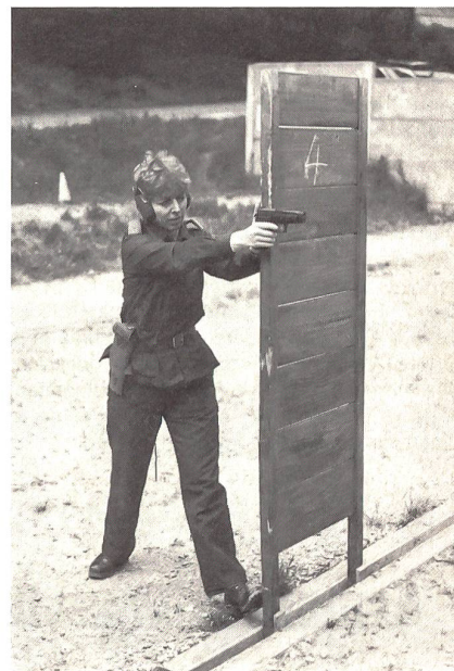
Maueranschlag rechts: Konzentrierte Schussabgabe von Mann und Frau