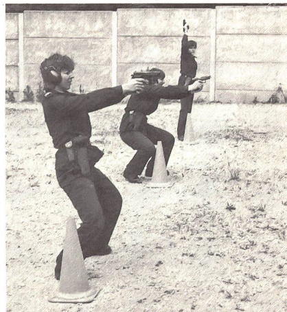
Die schnelle Schussabgabe stehend stellt hohe Anforderungen an Schützen und Schützinnen