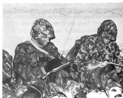
Die Zugführer der III. Kp beim Befehlsempfang im improvisierten KP, während der Übung Natter.

«Der Gegner fuhr auf unsere Sperre Döttingen auf, die gehalten wurde. Feindliche Artillerie und Raketenwerfer beschossen das südliche Rheinufer. Etwa 2255 erfolgte eine feindliche