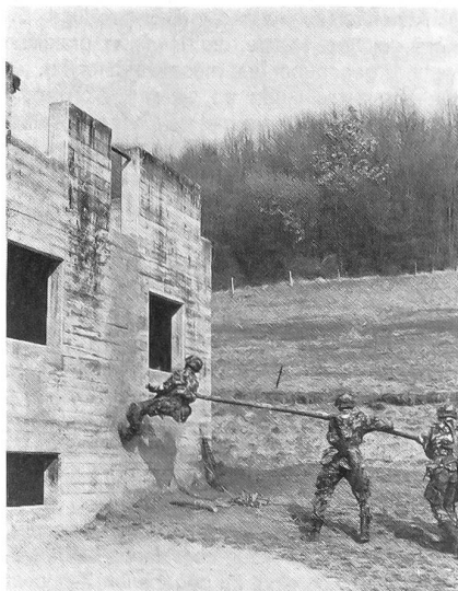
Häuserkampf. Hier eine Demonstration der Rekruten der III. Kp Inf RS 4/84. Ausbildungsstand achte Woche. In Sekundenschnelle ist ein Mann auf dem vorher «gesäuberten» Hausdach, eine Strickleiter wird nachgezogen, und das Haus ist besetzt.

Die neunte RS-Woche begann am 2. April für das Kader und die Mannschaft mit einer frühen Tagwache und anschliessend mit Verschiebung von Liestal nach Eiken, wo bis zum Mittag im Wald ein Biwak eingerichtet wurde. Bereits am Nachmittag wurde mit den Unteroffizieren in der nahen Ortskampfanlage Eiken gearbeitet. Das Schwergewicht in der Ausbildung während dieser nasskalten Woche lag im Kampf in und um Ortschaften und beim Waldkampf. Mit der immer dichter werdenden Überbauung und Besiedlung unseres Mittellandes wird diese Kampfart für unsere Infanterie von immer zunehmender Wichtigkeit. Geeignete Ausbildungsanlagen sind selten und müssen oft mit den Truppen des Zivilschutzes und Luftschutzes geteilt werden. Ein hoffentlich «vorläufiger» Wunschtraum ist die Verwirklichung eines «Dorfes», das zum Ortskampftraining im Massstab 1:1 benützt und auch ausgebaut werden kann.