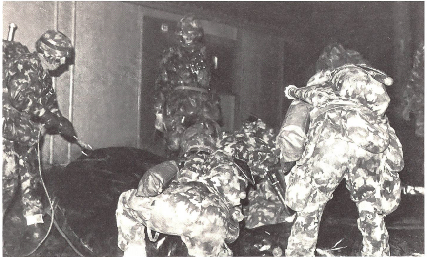
Der Steg 58 ist bereit, und gleich wird der Übergang der Kompanie beginnen.

Lautlos glitten die Boote ins Wasser, wurden bemannt und verschwanden bald, mit regelmässigen Paddelschlägen vorwärtsgetrieben, über die Aare. Zur Sicherung waren zwei Rettungsboote mit starken Scheinwerfern auf dem Fluss postiert, die aber diese Nacht glücklicherweise nicht eingzugreifen brauchten. Die Landung am andern Ufer gestaltete sich schwieriger als angenommen. Durch die unmerkliche,