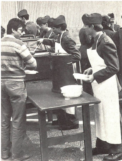
Curry-Geschnetzeltes, Trockenreis und Salat wurden den Besuchern am 31. März am Besuchstag angeboten. Es wurde oft «nachgefasst».

mandanten, gutes Schuhwerk mitzubringen, sah man da und dort eine Freundin oder Schwester zart beschuht durch den Schlamm hüpfen. Ein kleiner Vorgeschmack dessen, was der Herr Sohn bzw Freund so während der ganzen Woche am Körper spürt, wenn er auf Geheiss seiner Vorgesetzten, kriechend und alle Deckungen ausnützend, eine neue Stellung bezieht. Die Rekruten zeigten denn auch mit Eifer und Einsatz das Gelernte, und beim anschliessenden Mittagessen sah man manchen Vater mit seinem Sohn das «gefechtstechnische» Verhalten diskutieren.