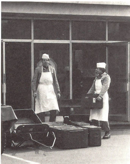
Die sichtbar gute Laune der Küchenmannschaft der III. Kompanie schlägt sich auch aufs Essen nieder. Die Kommentare der Truppe: durchwegs erstklassig.

Das Mittagessen ist für alle die willkommene Erholungspause. Natürlich ist gerade bei der kalten und nassen Winterwitterung eine reichhaltige und schmackhafte Mahlzeit für die Moral und Gesundheit von grosser Wichtigkeit. Und