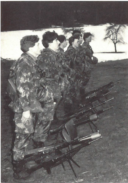
Kader, Kompanie Widmer zur Übung bereit.