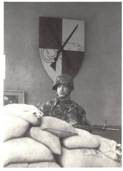
Stolz bewacht dieser zukünftige Füsilier den Eingang zur Kaserne.