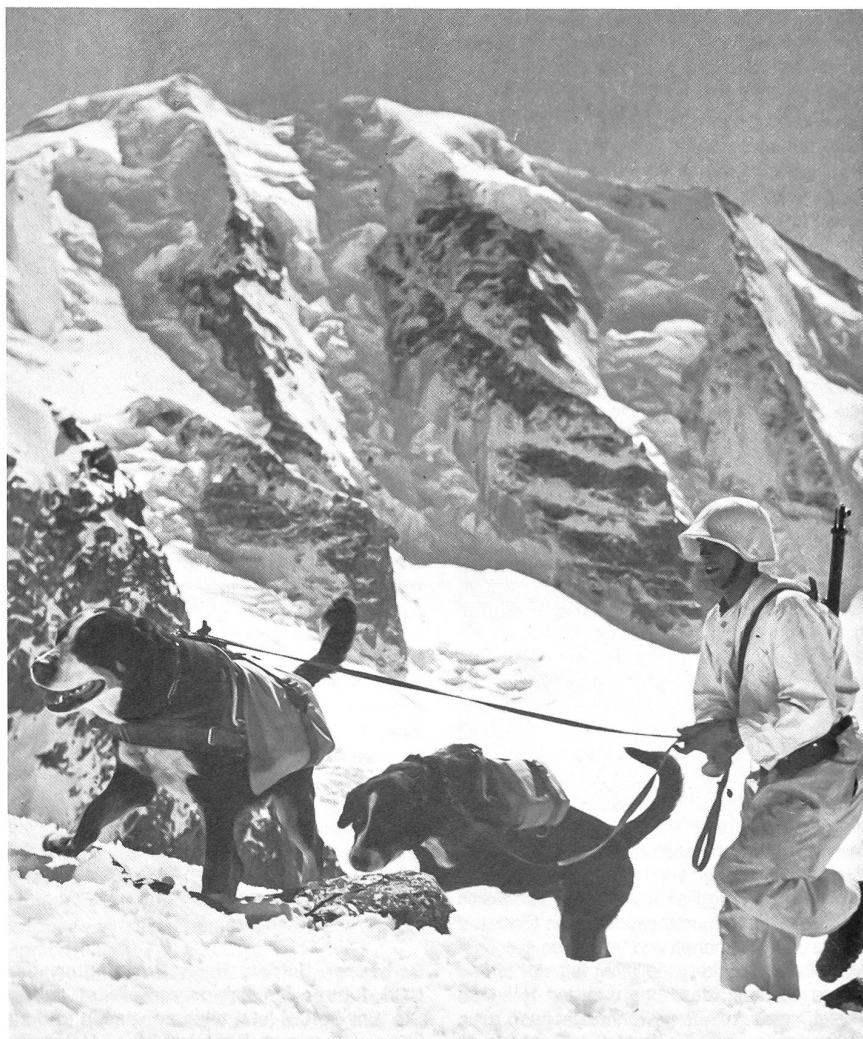
In den Kriegsjahren wurden die Hunde auch als Munitionstransporter verwendet.

Den Schutz- und Katastrophenhundeführern wird in zweiwöchigen, getrennten Einführungskursen die Grundausbildung für die militärischen Bedürfnisse vermittelt. Die Lawinenhundeführer haben ihre Kurse beim Schweizer Alpen-Club zu bestehen. Seit kurzem werden alle Hundeführer auf die Pistole 49 umgerüstet und sowohl im Stand- und auch im Gefechtsschiessen ausgebildet.