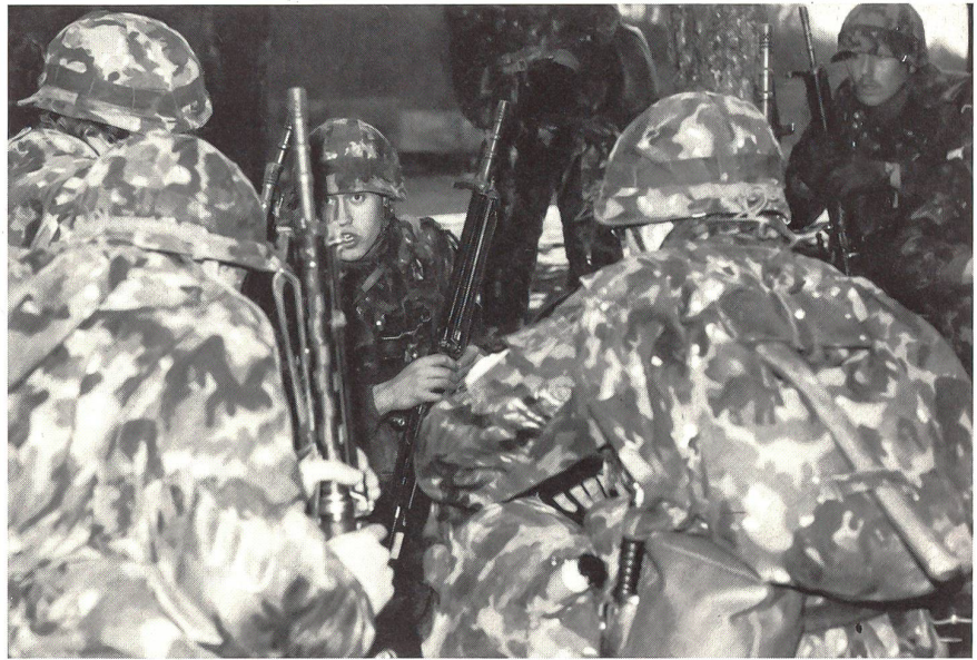
Der Korporal orientiert und befiehlt.