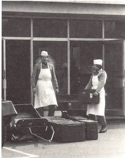
Die sichtbar gute Laune der Küchenmannschaft der III. Kompanie schlägt sich auch aufs Essen nieder. Die Kommentare der Truppe: durchwegs erstklassig.

Das Mittagessen ist für alle die willkommene Erholungspause. Natürlich ist gerade bei der kalten und nassen Winterwitterung eine reichhaltige und schmackhafte Mahlzeit für die Moral und Gesundheit von grosser Wichtigkeit. Und