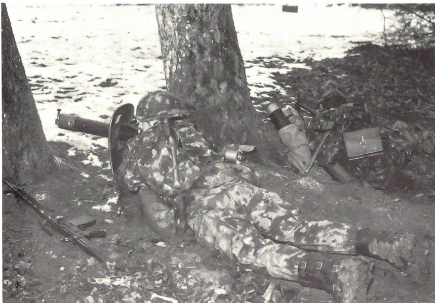
Gruppe sichert die Befehlsausgabe.