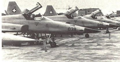
Maschinen des Typs Tiger startbereit auf dem Dübendorfer Flugfeld.