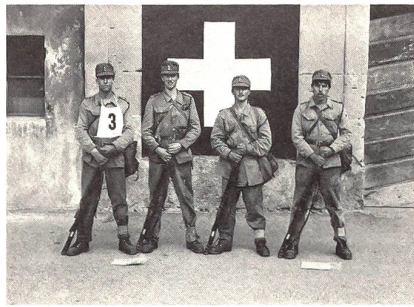
Patrouille vor dem 30-km-Schlussmarsch

Bei den Ausbaurbeiten für das Jugendsportzentrum (CST) in Tenero am Langensee bei Locarno ist Aufrichte gefeiert worden. In einer ersten Etappe des von der Eidg Turn- und Sportschule Magglingen betriebenen Zentrums wurden eine Sporthalle, Spielfelder, Schwimm- und Leichtathletikanlagen erstellt. Das CST plant, in einer zweiten Etappe auch die Unterkünfte zu erneuern. Bild: Mehrzweckhalle (Hintergrund) und eines von drei Schwimmbecken (im Vordergrund).