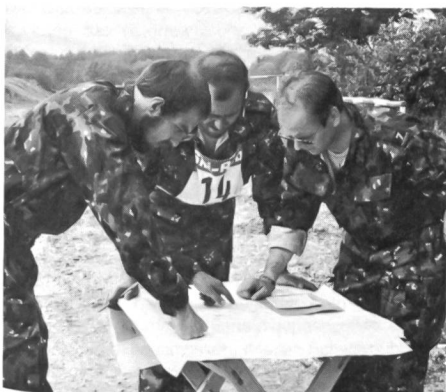
Eine sorgfältige Routenwahl zahlte sich im 70 minütigen Skorelauf besonders aus. Die erste Formation des UOV Bischofszell beim Überprüfen der eingetragenen Posten.

gestreut, nämlich Beobachtung, Bekämpfung von Saboteuren, Waffendruck (Natogewehr G3), Pistolen-schiessen, Panzer- und Flugzeugerkennung, Kompassmarsch, Radwechsel, Signaturenkenntnis, Überquerung der Donau am Seil, Schlauchbootfahrt, Kameradenhilfe, Distanzschätzen und Skorelauf. Unter den 18 Gästemannschaften (Dreierpatrouillen) konnten die Vertreter des SUOV folgende Ränge belegen: