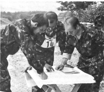
Eine sorgfältige Routenwahl zahlte sich im 70 minütigen Skorelauf besonders aus. Die erste Formation des UOV Bischofszell beim Überprüfen der eingetragenen Posten.

gestreut, nämlich Beobachtung, Bekämpfung von Saboteuren, Waffendruck (Natogewehr G3), Pistolen-schiessen, Panzer- und Flugzeugerkennung, Kompassmarsch, Radwechsel, Signaturenkenntnis, Überquerung der Donau am Seil, Schlauchbootfahrt, Kameradenhilfe, Distanzschätzen und Skorelauf. Unter den 18 Gästemannschaften (Dreierpatrouillen) konnten die Vertreter des SUOV folgende Ränge belegen: