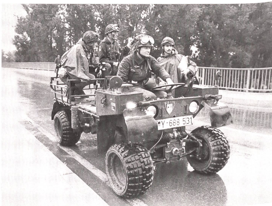
Fallschirmjäger auf dem Marsch mit ihrem «Kraka» (Kraftkarren), einem leichten, 0,75 t schweren, luftverlastbaren Fahrzeug

Im Spannungs- und Verteidigungsfall übernimmt die Heeresgruppe Mitte der NATO (Central Army Group) mit dem VII. US Korps, einem kanadischen Verband und dem II. Korps der Bundeswehr grenznah die Verteidigung und den Raumschutz. Inwieweit die drei französischen Panzerdivisionen in Südwestdeutschland miteinbezogen werden können, dürfte sich