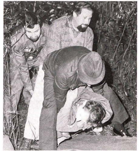
Auch das Bergen der «Verletzten» gehörte zur wirklichkeitsnahen Spreng- bzw Sanitätsübung des UOV Bischofszell.

ren die Mitarbeit bei den Schweizerischen Artillerietagen und beim Jubiläum «50 Jahre Frauenfelder Militärwettkampfmarsch und 50 Jahre Thurgauer Militärtrömpeter». Weil daneben die Mitgliederwerbung nicht ganz die gewünschten Erfolge zeigte, wird zu vermehrter Aktivität in dieser Richtung aufgerufen, besonders im Hinblick auf die SUT 85 in Chamblon/Yverdon. Daneben ist der Marschgruppenführer des UOV Frauenfeld auf der Suche nach Wehrmännern, die an einer Teilnahme am Berner Zweitagemarsch und am Viertagemarsch von Nijmegen (Holland) interessiert sind.