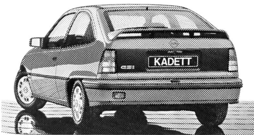
Kadett GSi: Hochwertige Technik geprägt von Ihren Wünschen.

Lassen Sie sich bei einer Probefahrt begeistern!