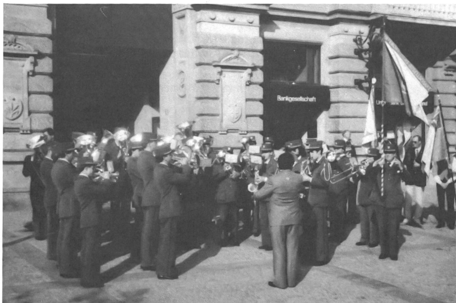
Das Schützenspiel der UOG Zürich feierte das 50jährige Bestehen.

Anmeldeschluss: 19. Oktober 1985. Die offizielle Beschreibung samt Anmeldetalon ist erhältlich bei SVMLT Sektion Zentralschweiz, Postfach 229, 6000 Luzern 6, Zürichstrasse.