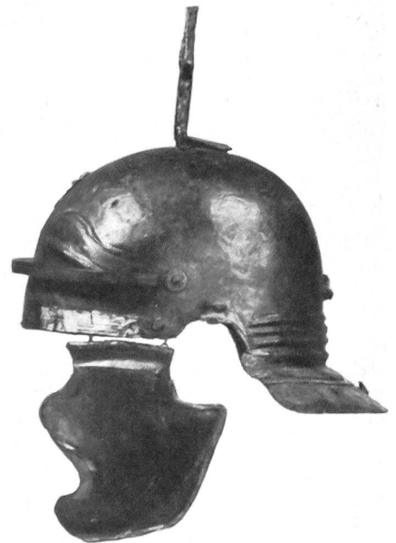
Solche Helme trug man im Jahre 69. 1979 von J. Weiss in Windisch gefundener römischer Eisenhelm aus dem 1. Jahrhundert nach Christus. Abbildung nach Martin Hartmann, ein Helm vom Typ Weisenau aus Vindonissa, Gesellschaft Pro Vindonissa, Jahresbericht 1982, Seite 6.