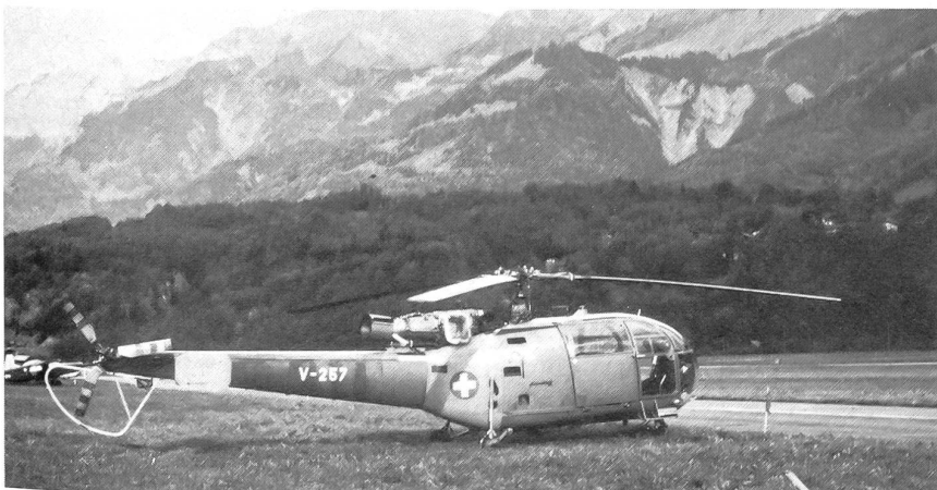
Alouette III Mehrzweckhubschrauber. Das UeG setzt diesen Typ beim Militärhubschrauberrettungsdienst ein.

Die Schweizer Armee beruht auf dem Prinzip des Milizsystems, das heisst, dass keine Berufseinheiten zur Sicherung unseres Landes bestehen. Eine Ausnahme dazu bildet das Überwachungsgeschwader (UeG), das als Teil der Flugwaffe der einzige Berufsverband unserer Armee ist.