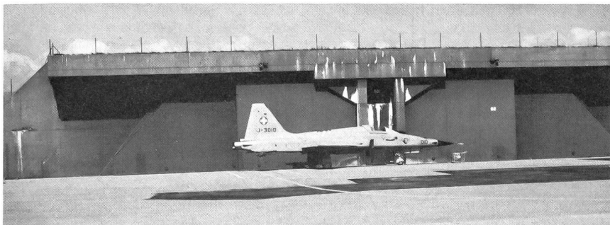
F-5E Tiger II der Staffel 18 vor einem Unterstand. Sämtliche Flugzeuge des UeG sind vor Feindeinwirkungen wirkungsvoll in Felskavernen oder in NEMP-gehärteten Unterständen geschützt.