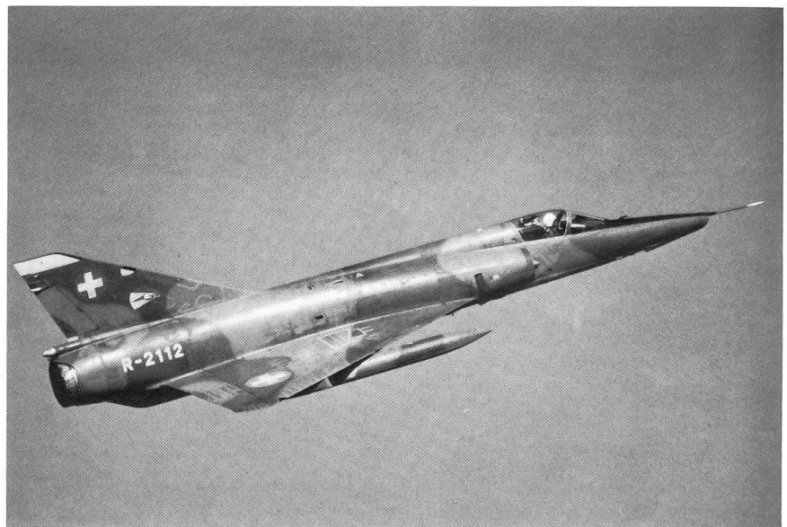
Mirage IIIRS Aufklärer der Staffel 10.