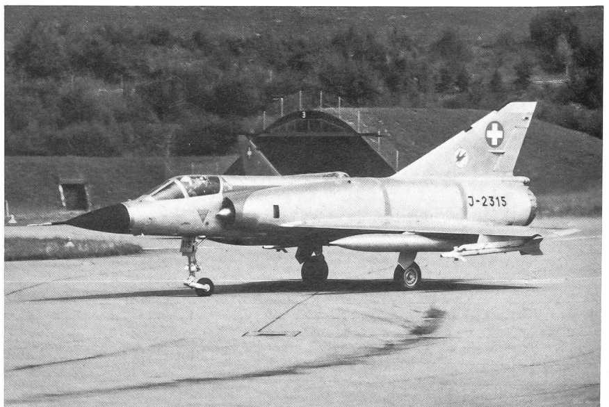
Mirage IIIS der Staffel 17 des UeG. Das UeG setzt zwei Staffeln Mirage IIIS für Abfangjagdaufgaben ein.