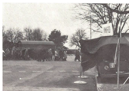
Bei den Motorfahrern

Seit dem 6. Februar 1984 sind in die Kaserne Kloten 78 Rekruten und 23 Unteroffiziere der Betriebsrekrutenschule eingezogen. Die jungen Wehrmänner werden während einer harten und interessanten Rekrutenschule der Übermittlungstruppen zu Betriebspionieren, Motorfahrern und Küchengehilfen ausgebildet. Hauptaufgabe der Betriebspioniere ist das Installieren, Betreiben und Unterhalten von Fernschreiberstationen in einem Kommandoposten auf Stufe Armee, Armeekorps, Division, Brigade oder Regiment.