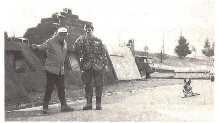
Die Lage für die Entschlussfassung zum Einsetzen des Hundes.