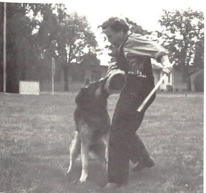
Selbständiges Unterbinden eines Fluchtversuches ohne Einwirken des Führers