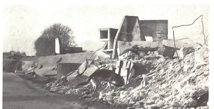
Das Zeigen des Figuranten, um beim Hund die Beziehung und die Freude zur gefundenen Person zu steigern.