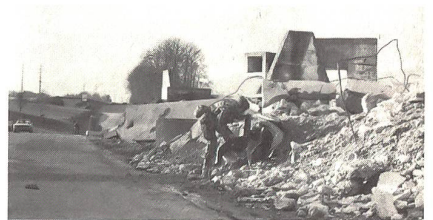
Anzeigen eines Verschütteten