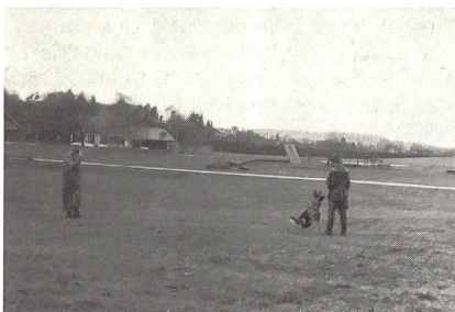
Zur Allg.-Ausbildung gehören auch Gehorsamsübungen