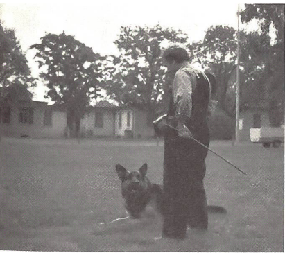
Bewachen einer Person