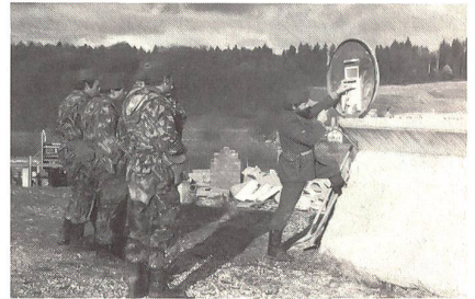
Den Hund auf das Anzeigen vorbereiten (mit System)