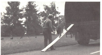
Allgemeines Training: Begehung von Hindernissen