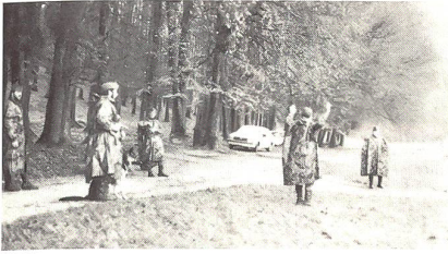
Stellen eines Verdächtigen