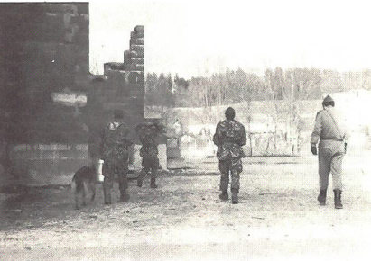
Abtransport einer Person