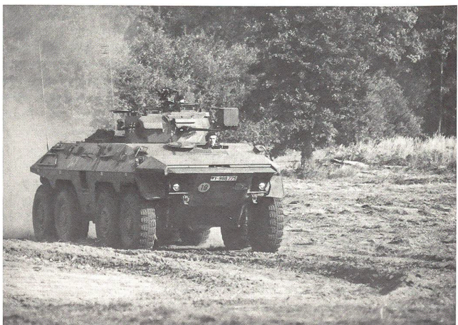
Spähpanzer Luchs, Waffensystem der Panzeraufklärer