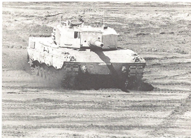
Kampfpanzer Leopard, das Rückgrad der Kampftruppen

Der Wehrgedanke steht in keinem Zusammenhang mit Nähe oder Ferne der Gefahr, mit der Gunst des Augenblicks oder der Unwahrscheinlichkeit des Erfolges. Div Edgar Schumacher (1897–1967)